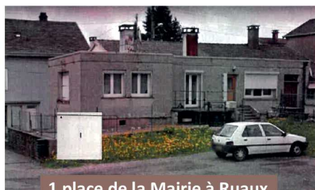
1 place de la Mairie à Ruaux : à l'entrée de la place