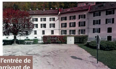
2 rue Fulton : à l'entrée de la commune en arrivant de Remiremont