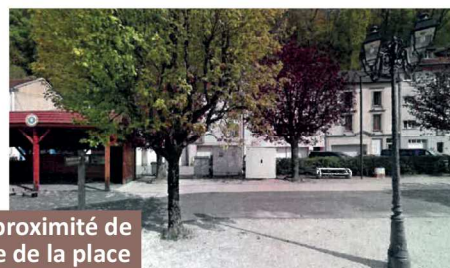
2 rue Fulton : à proximité de l'abri-bus proche de la place Beaumarchais